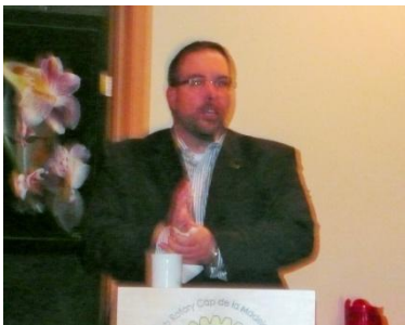
Le président a montré l'exemple

Enfin, afin de participer à la journée mondiale du Rotary contre la polio les membres du club ont trempé le petit doigt dans une encre de couleur afin de marquer et de rendre visible leur engagement dans ce combat contre la maladie. Depuis plus de 20 ans les clubs Rotary du monde entier financent une campagne de vaccination dans tous les pays où cette maladie terrasse encore de jeunes enfants.